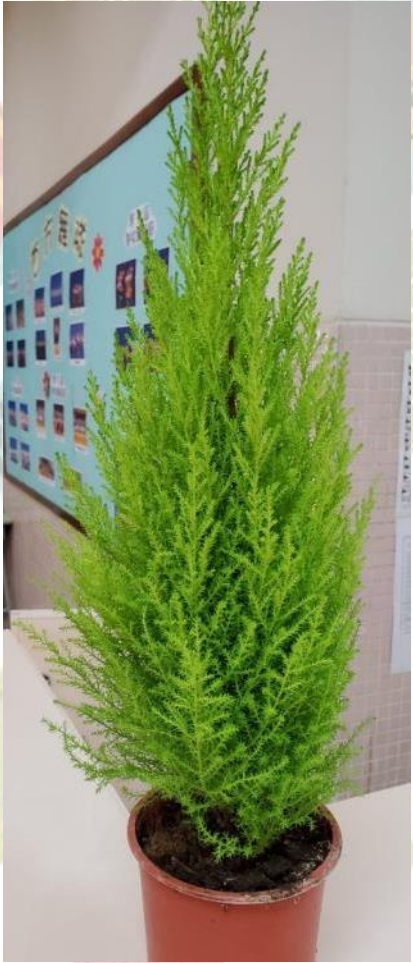
綠化校園及校園環保