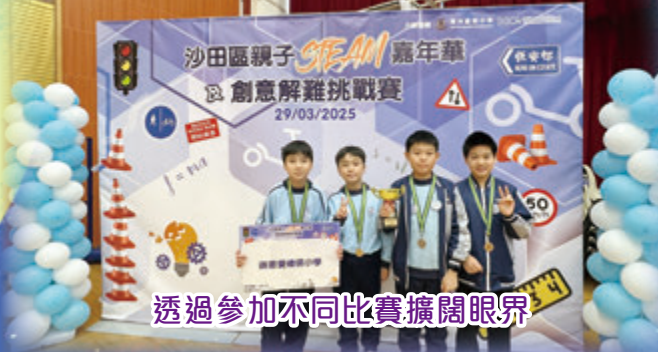
透過參加不同比賽擴闊眼界

這次STEAM Day令我非常難忘！我製作了一架風帆車，一開始風帆車未能走得很遠，經過我不停反覆測試及改良，最後可以走到100厘米！在這個學習經歷中，我明白到只要不放弃，一定會成功。