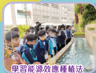
學習能源效應種植法