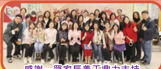
感謝一眾家長義工鼎力支持