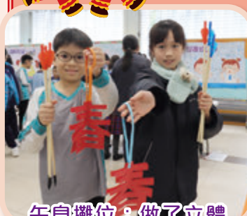
午息攤位：做了立體揮春再去投壺