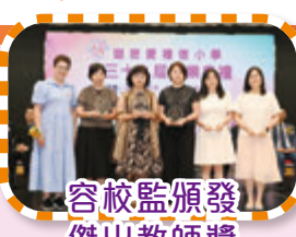
容校監頒發傑出教師獎