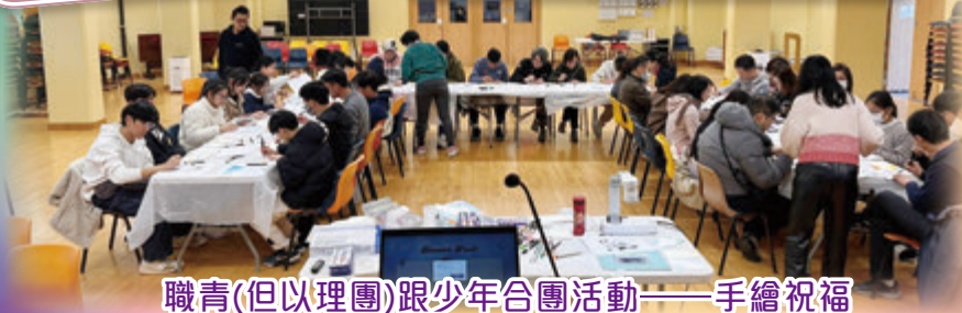
職青(但以理團)跟少年合團活動——手繪祝福