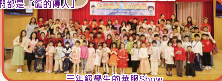
三年級學生的華服Show