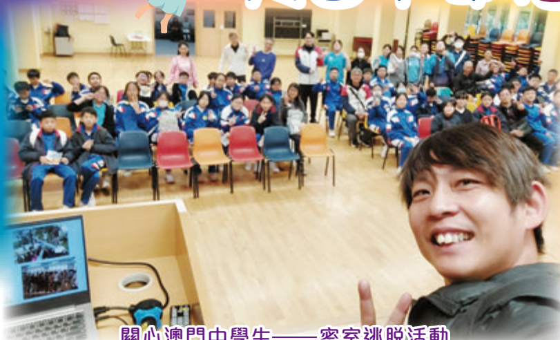
關心澳門中學生——密室逃脫活動