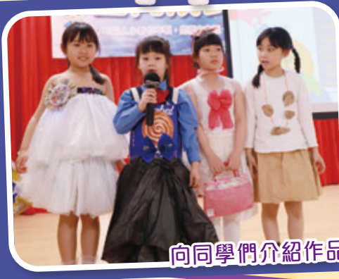
向同學們介紹作品理念