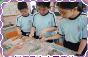
同來製作中華美食——糖不甩