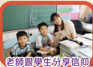
老師跟學生分享信仰