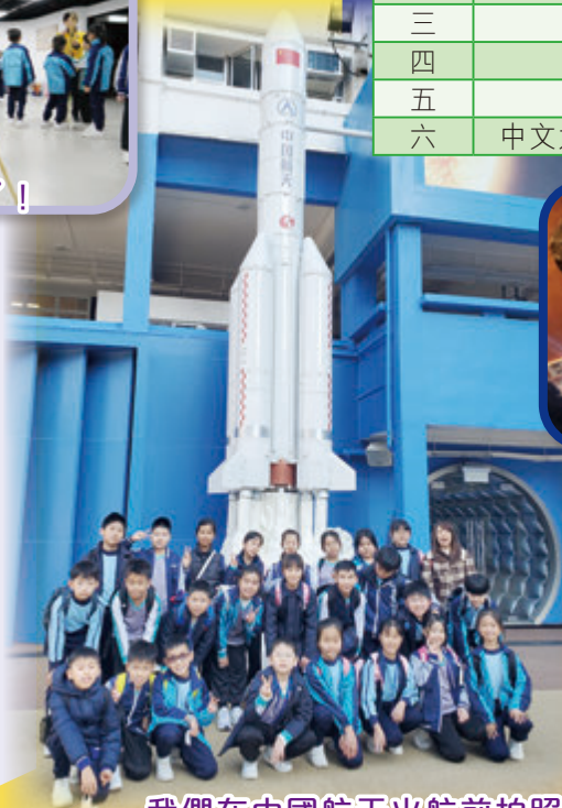
我們在中國航天火航前拍照