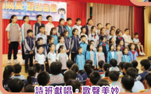
詩班獻唱，歌聲美妙