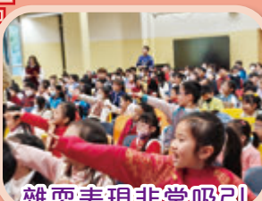
雜耍表現非常吸引