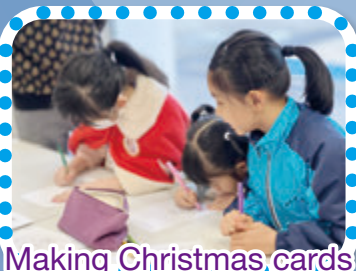
Making Christmas cards