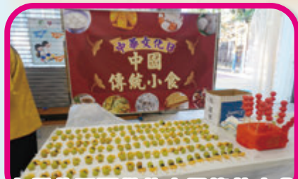
家長義工預備的中國傳統小食