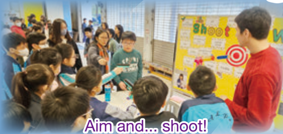
Aim and... shoot!

We wrapped up English Day on 19 th December with a bang! With a festival Christmas theme, our students enjoyed a multitude of activities throughout the day. We had an engaging drama musical centered around the nativity scene where students displayed their skills as actors and MCs. Our English Ambassadors hosted fun, interactive booth games for their fellow students with a Christmas flair. This celebration not only highlighted student creativity, but also fostered a joyful atmosphere for using English.