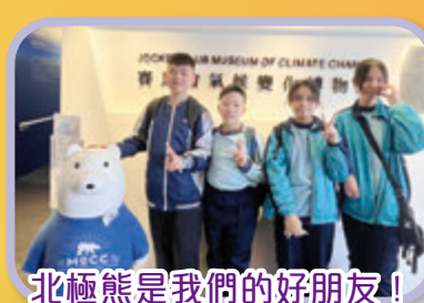
北極熊是我們的好朋友！