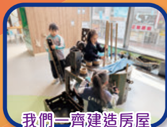
我們一齊建造房屋