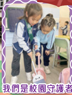
我們是校園守護者