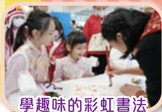
學趣味的彩虹書法