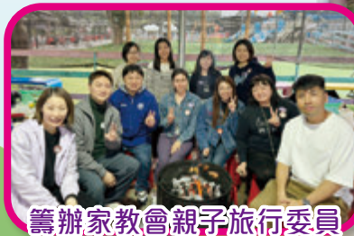
籌辦家教會親子旅行委員