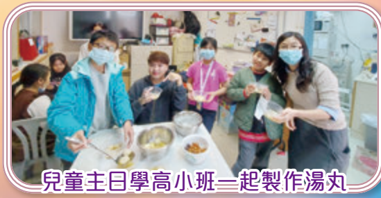
兒童主日學高小班——一起製作湯丸