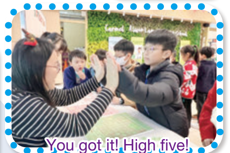
You got it! High five!