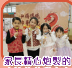
家長精心炮製的冰糖葫蘆甜蜜蜜