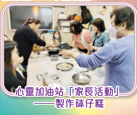
心靈加油站「家長活動」——製作砵仔糕