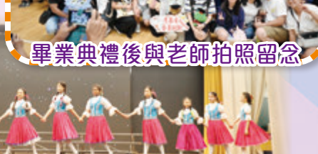
本校西方舞隊為畢業典禮表演