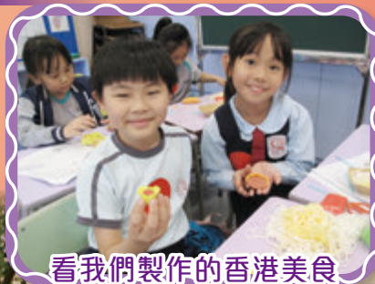
看我們製作的香港美食