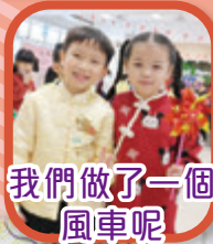
我們做了一個風車呢