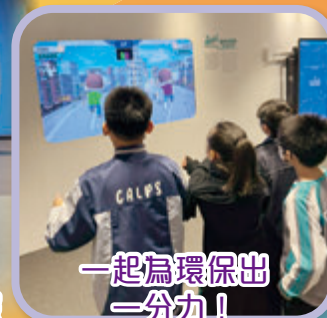
一起為環保出一分力！