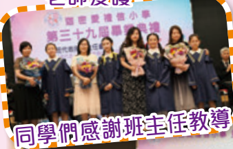
同學們感謝班主任教導