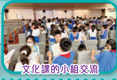
文化課的小組交流