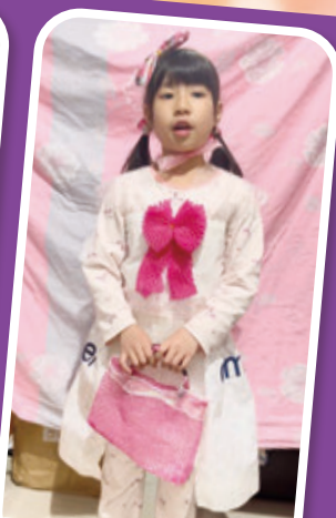
參賽同學拍攝影片介紹設計