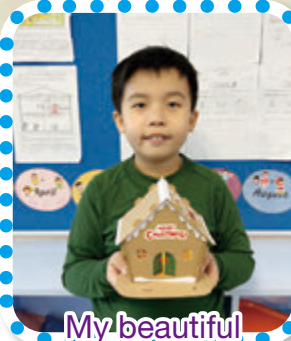
My beautiful gingerbread house