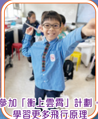
參加「衝上雲霄」計劃，學習更多飛行原理