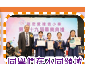
同學們在不同領域上取得佳績