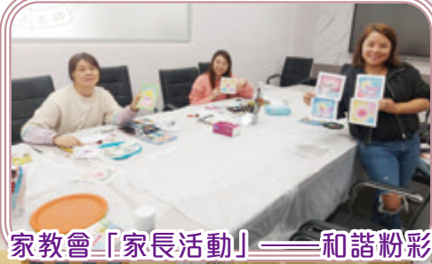
家教會「家長活動」——和諧粉彩