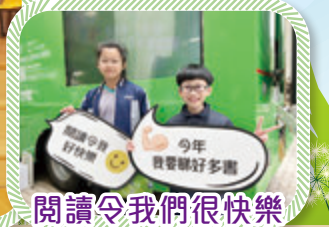
閱讀令我們很快樂