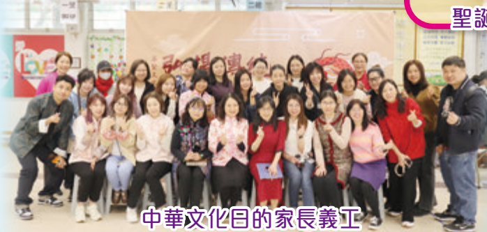
中華文化日的家長義工