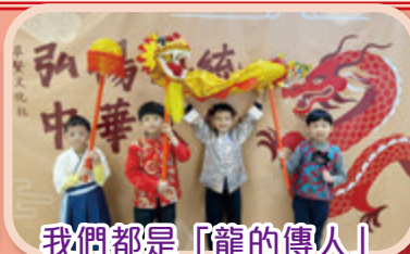
我們都是「龍的傳人」