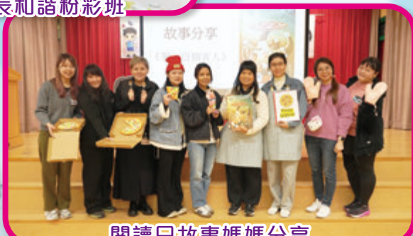
閱讀日故事媽媽分享