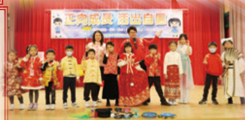
校長和同學一起參與互動環節

1月24日的「中華文化日」是「中華文化月」的壓軸活動。中式雜耍及古彩戲法的表演，讓學生欣賞中國傳統文化及技藝；參與攤位活動，學生可體驗中國民間玩意，品嚐傳統美食；透過生肖起源的介紹，讓學生認識中國傳說；高年級製作龍的合作畫，了解「龍的傳人」的意義。學生享受其中，一眾家長與孩子同樂，場面溫馨，濃厚的氛圍定能加深他們對國民身份的認同，培養愛國情懷。