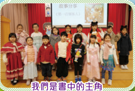
我們是書中的主角