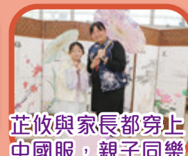
芷攸與家長都穿上中國服，親子同樂