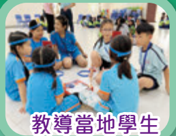
教導當地學生玩桌上遊戲