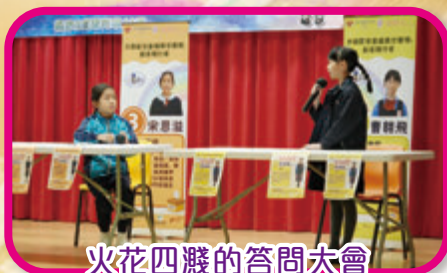
火花四濺的答問大會