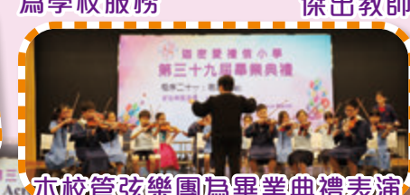
本校管弦樂團為畢業典禮表演