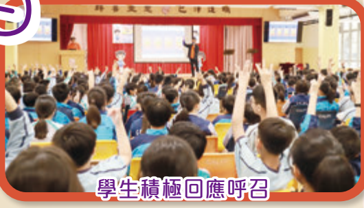
學生積極回應呼召