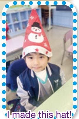
I made this hat!