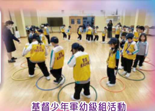
基督少年軍幼級組活動