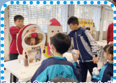
Feeding Santa some snowballs