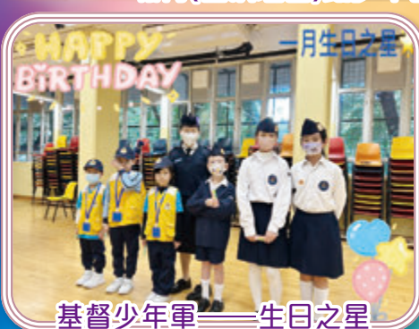
基督少年軍——生日之星