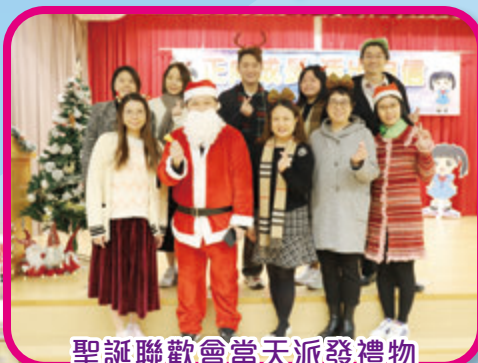
聖誕聯歡會當天派發禮物