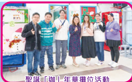
聖誕「迦」年華攤位活動