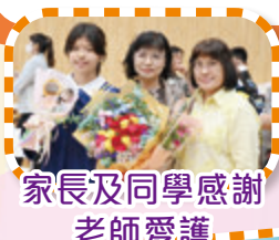
家長及同學感謝老師愛護