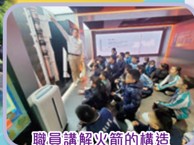
職員講解火箭的構造