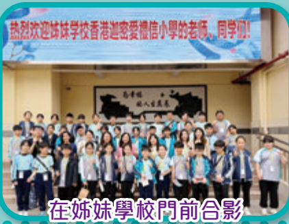
在姊妹學校門前合影

在這次學習活動中，同學探訪了深圳寶安實驗學校，與姊妹學校的學生一起上文化課，一同合作朗讀古詩文。同學在廣東話與普通話的交融中，感受到語言的魅力與文化的深厚，同時亦加深對中華文化的認識。