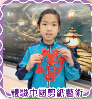
體驗中國剪紙藝術