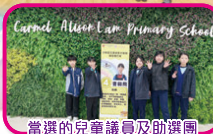
當選的兒童議員及助選團