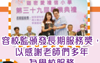
容校監頒發長期服務獎，以感謝老師們多年為學校服務