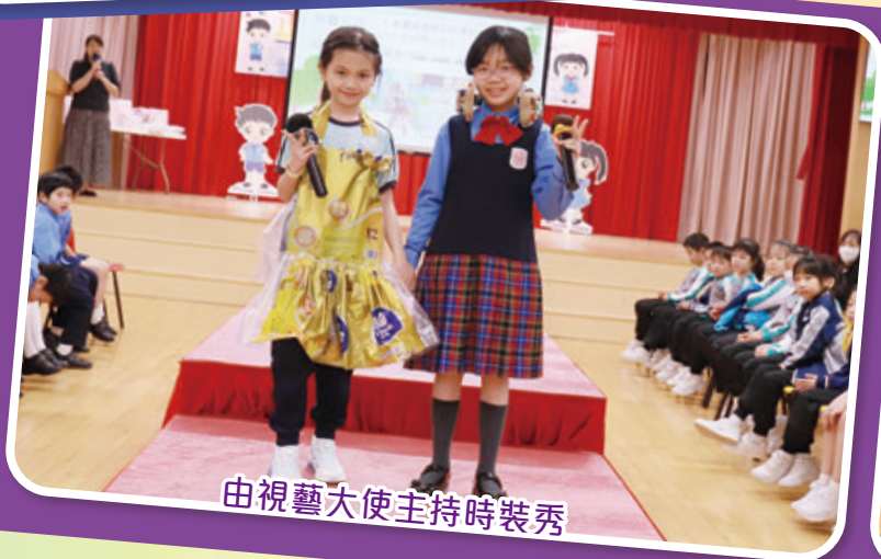
由視藝大使主持時裝秀