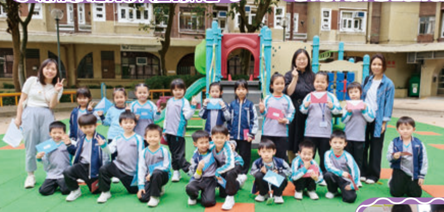
齊來認識我們學校的社區