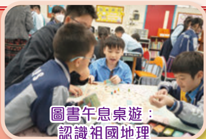
圖書午息桌遊：認識祖國地理