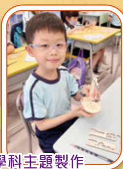
上下學期均有一個跨學科主題製作