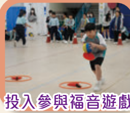
投入參與福音遊戲