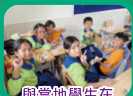
與當地學生在課堂以英語交流