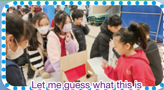
Let me guess what this is