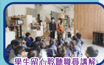
學生留心聆聽職員講解