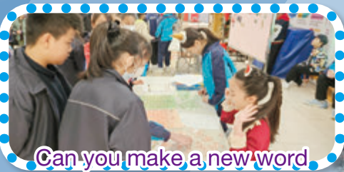
Can you make a new word