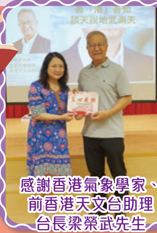
感謝香港氣象學家、前香港天文台助理台長梁榮武先生到校分享