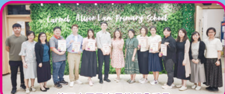
第二十五屆家長教師會委員

各委員在第二十五屆家長教師會任期即將屆滿。在這一年間，我衷心感謝迦密愛禮信小學一群強大的家長團隊。家長們積極參與和籌辦各類校內活動，充分體現了家校合一的精神，實在感恩！期待未來，家長與學校繼續攜手，培育學生，建立身心靈健康的孩子，讓他們在各方面都能茁壯成長！