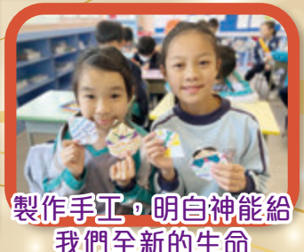
製作手工，明白神能給我們全新的生命