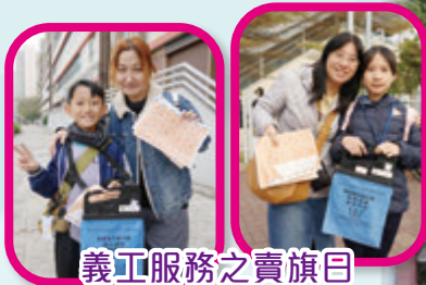
義工服務之賣旗日