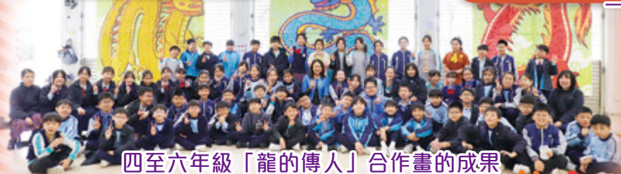
四至六年級「龍的傳人」合作畫的成果