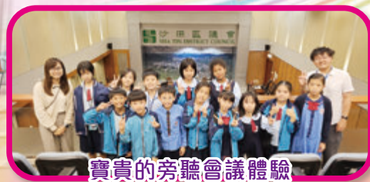
寶貴的旁聽會議體驗