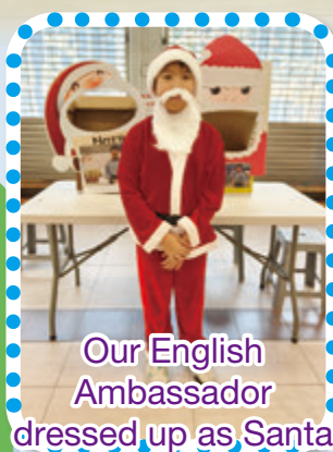
Our English Ambassador dressed up as Santa