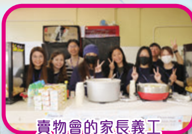
賣物會的家長義工