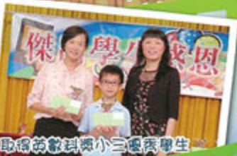
取得高級科學小三優異學生