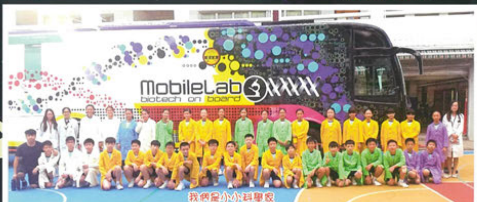
我們是小小科學家