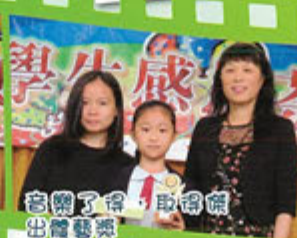
音樂了得，取得傑出體藝獎