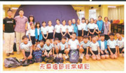
天幕環節非常精彩