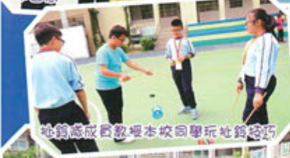
社鎮感成百教授本校同學玩社鎮技巧