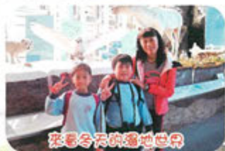
來看冬天的濕地世界