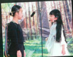
The Princess and the Prince