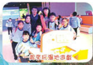
一起來玩場地遊戲