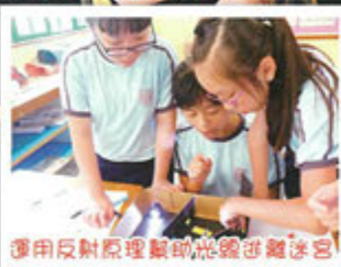
運用反射原理幫助光強透鏡迷宮