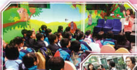
同學用心聆聽 黃老師講解