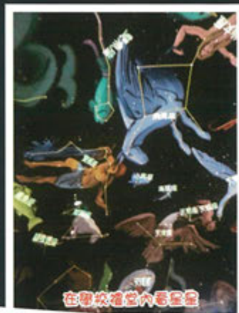
在學校禮堂內看星星