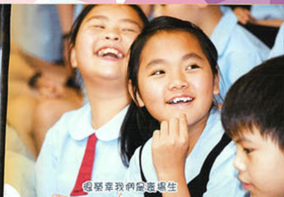
很榮幸我們是表演生