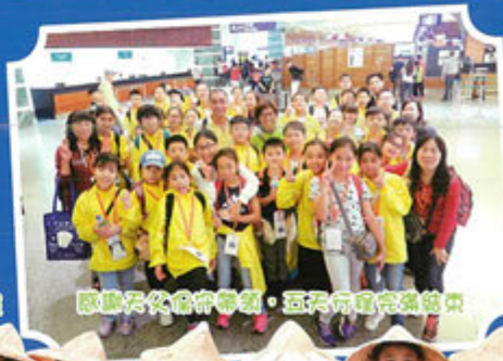
感謝天代旅行社帶領，五天行程完美結束