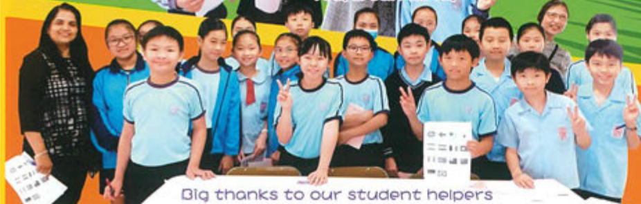
Big thanks to our student helpers