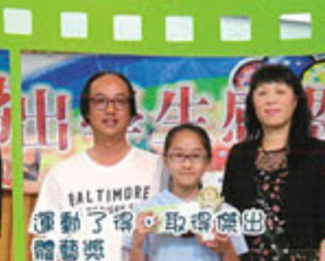
運動了得，取得傑出體藝獎