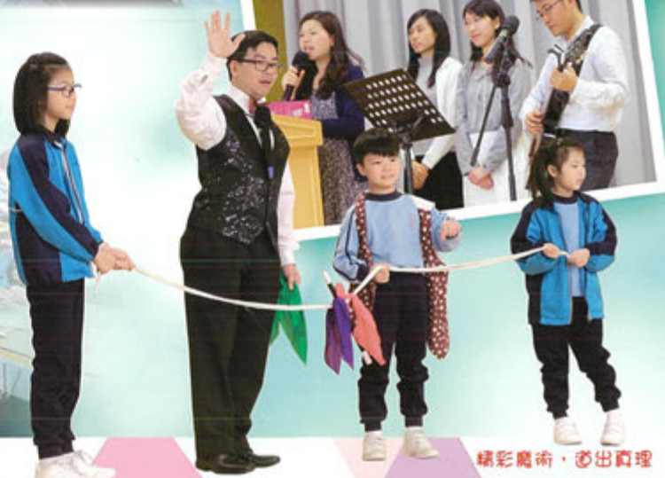
精彩魔術，道出真理