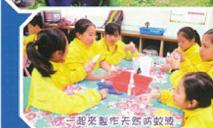
一起來製作天然防蚊液