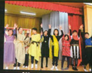
What a show!