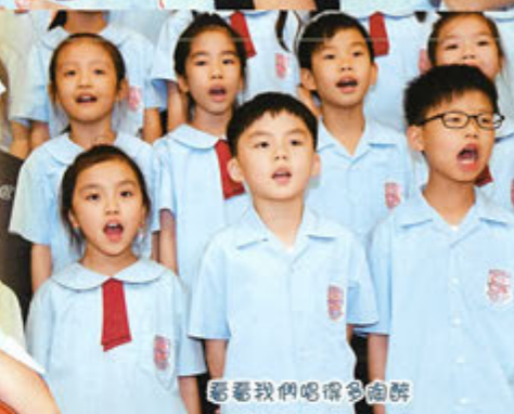
看看我們唱得多愉快