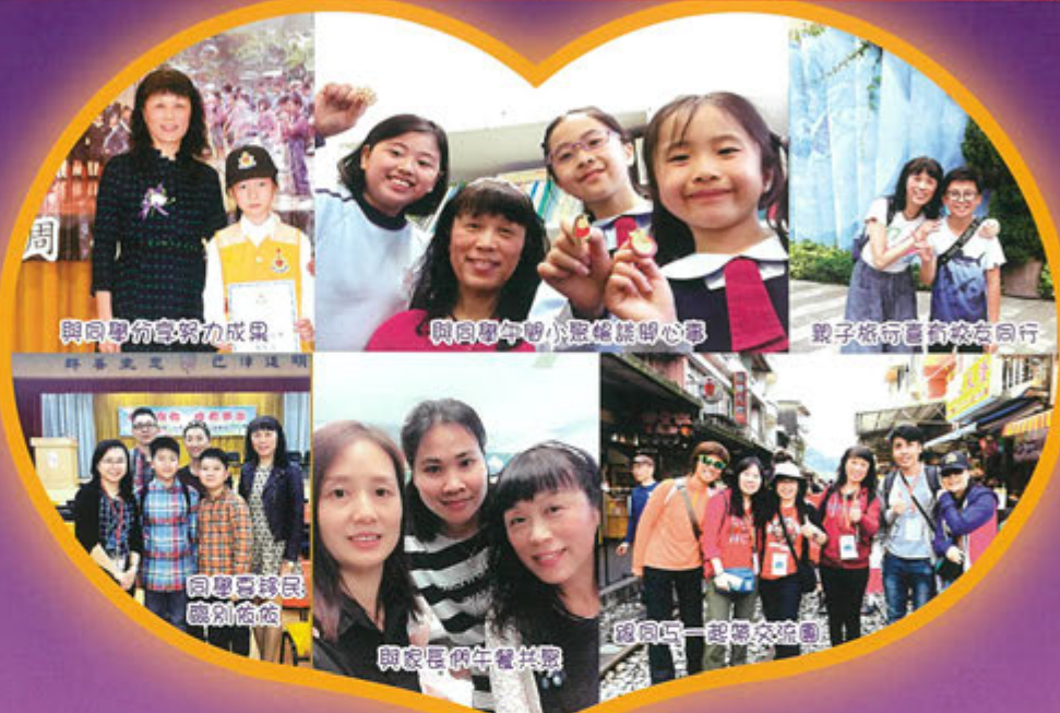
與同學有努力成果

身為基督徒老師，在傳遞基督教教育佔了非常重要的角色，老師毋須完美無瑕，但他們必須要與神和學生保持良好的關係，他們更需要終身學習、謙卑向他人學習（包括學生）、尊重自己及他人的生命、不斷自我完善；他們更需要有健康的形象，作為學生的學習榜樣。期望自己能帶領整個教師團隊承擔辦學團體的託付；先是帶領，過程中要重視如何服侍及成全團隊成員，並促成老師們成熟至能承接使命。