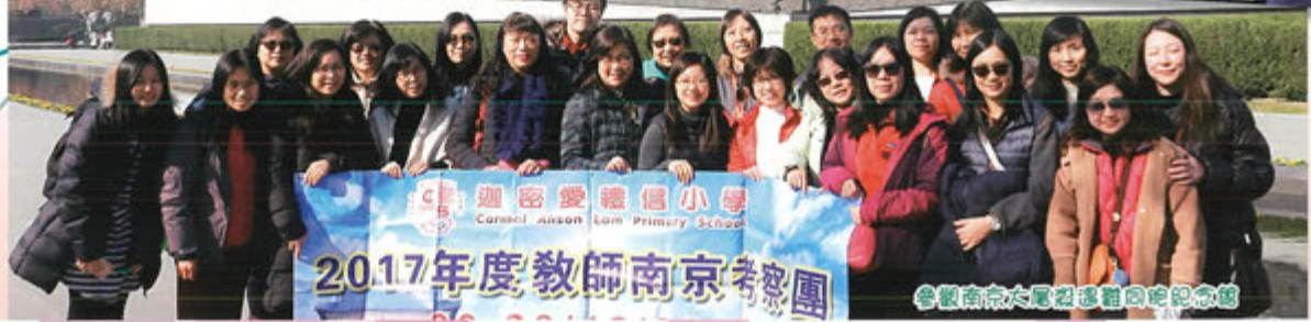
2017年度教師南京考察團