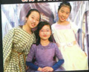
Anyone can be the queen