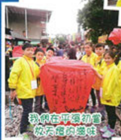
我們在平溪初嘗吃元霄的滋味