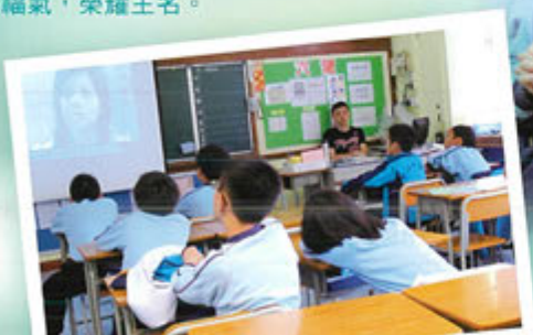
影音分享神愛世人的信息