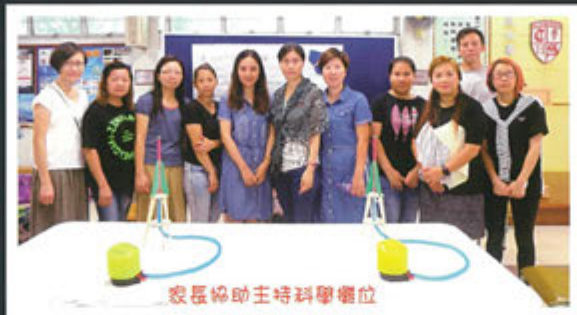
家長協助主持科學攤位