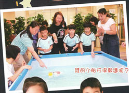
誰的小船行得較遠呢?