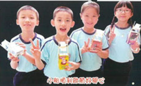
小船順利啟航好開心