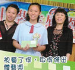
視藝了得，取得傑出體藝獎