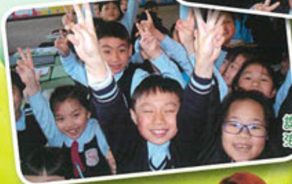
課堂「響蚊蚊」，繼續好氣氛