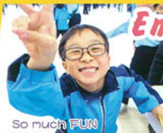
So much FUN