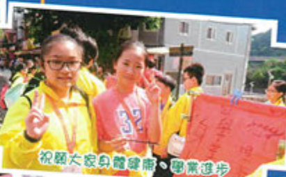
祝願大家身體健康、學業進步