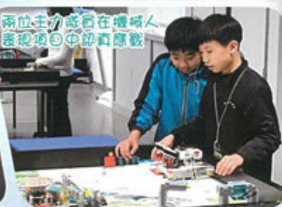
兩位主力成員在機械人表現項目中認真應戰

在全港STEM機械人大賽中奪得證書 香港理工大學及真鐸學校主辦 全港STEM機械人大賽