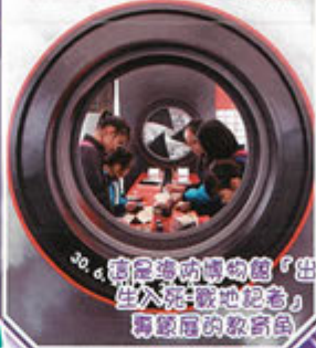
30. 香港海防博物館「出生入死-戰地記者」專題展的教育角