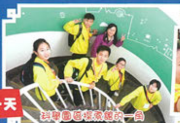
科學園區探家館的一角