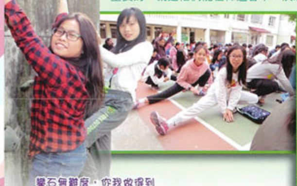
攀石無難度，你我做得好

六年級的同學在粉嶺宣道園進行三日兩夜的生活營，同學們透過小組分享、遊戲、比賽、角色扮演、燒烤……等不同活動，讓大家能夠加深認識，分享生活點滴，並學習與人相處、互相合作、彼此包容、團結合一的精神。而更重要的，就是他們能在佈道會中，決志信主，在主的愛裡健康快樂地成長。