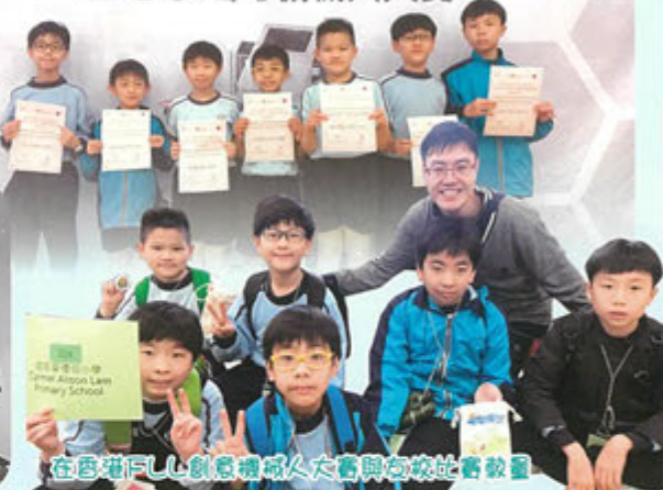
在香港FLL創意機械人大賽與各校比賽教員

在全港STEM機械人大賽中奪得證書 香港理工大學及真鐸學校主辦 全港STEM機械人大賽