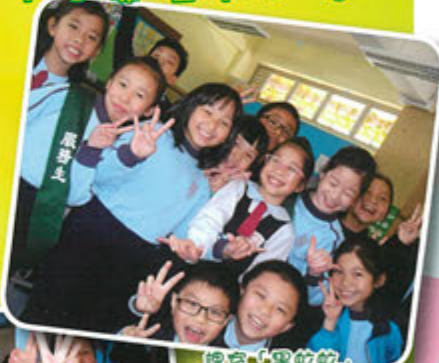
課堂「響蚊蚊」，Captain says, 'WELL DONE!'