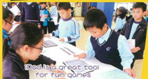
Dad is a great tool for fun games