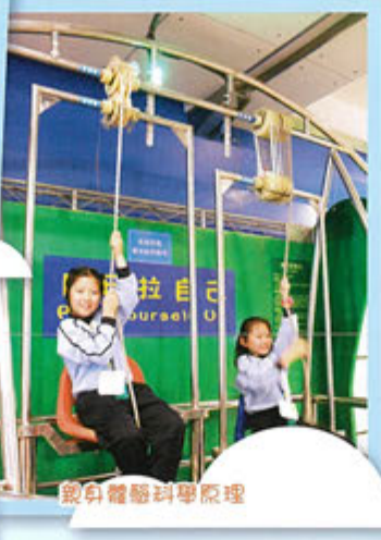
親身體驗科學原理