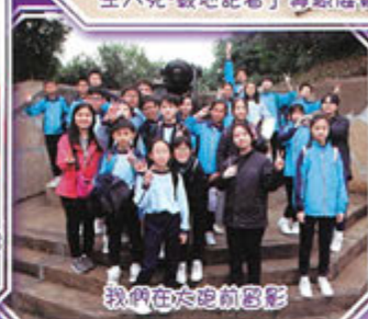
我們在六邊形合影