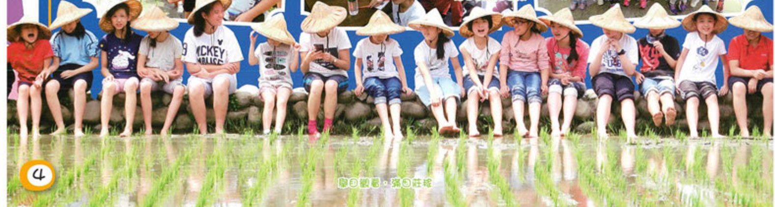
與自體攝，與自體攝