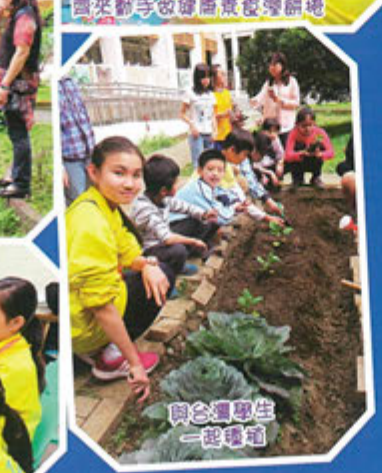
與台灣學生一起種菜