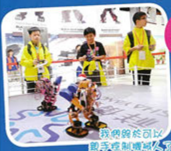
我終於可以 親手控制機械人了

其次，我的見識也廣博了，在機械人夢工場中，我看到許多機械人，見證了科技發展迅速，日新月異，也參觀了台灣高鐵的歷史，這一切一切，令我獲益良多呢！最後，我亦學會了注重環保，少用不能重用的產品，以免破壞地球生態環境！