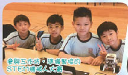
參與工作坊，學懂緊密的STEM機械人大賽

本校一直致力發展STEM教育，成立兩年的機械人校隊曾參與本港不同的機械人比賽。今年機械人校隊除了參與逢星期一的恒常的校隊訓練及比賽加時訓練外，部分的校隊成員也會參與周三「LEGO® 機械人」興趣小組。參與周三興趣小組的校隊成員組成「Robot Team」，向未成為校隊成員的同學分享機械人組裝、編程及分享比賽的經驗，實踐教學相長。尚未成為校隊成員的同學則組成「Makers' Team」，在校隊負責老師和其他「Robot Team」核心成員指導下使用「LEGO® Mechanic Set」製作機械作品，從中學習不同的機械原理，發展對機械科技的認識與興趣。這樣的新嘗試，使本校普及機械人教育再邁進了一大步。