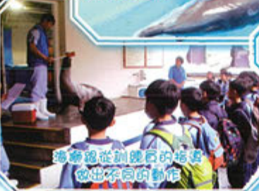
海獅從訓練員的指導 做出不同的動作