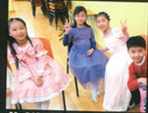
Waiting for the show