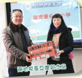
兩地校長互贈紀念品