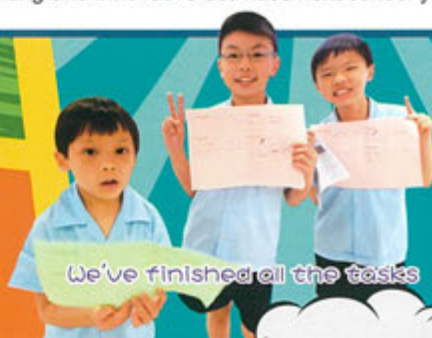
We've finished all the tasks