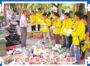
留心聽取社區工作者的講解