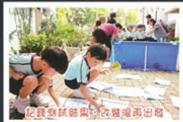
記錄測試結果，改壞壞再出招