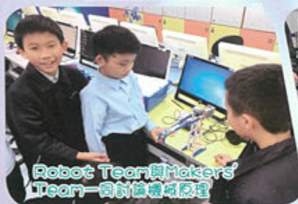
Robot Team與Makers' Team一同討論機械原理