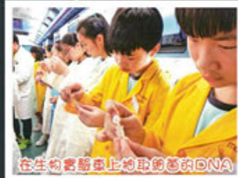
在生物書顯色上提取的基因DNA