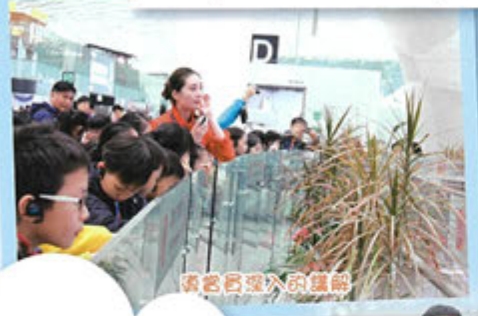
透過展架深入了解

本年度學校首次響應參與由教育局資助的「同根同心」高小學生內地交流活動計劃，參與活動名為「深圳航空與科技探索之旅」，學生透過參觀深圳寶安國際機場，認識內地機場的建築、規模和設施，並了解深港兩地機場的關係和異同。另外，透過參觀少兒科技館不同的科普展廳及展品，讓學生認識科學新知識和科技原理，體驗探索科學的樂趣。總括而言，師生對行程都相當滿意，特別是首次到國內共晉豐富的午餐；最重要的是，學生能擴闊視野，以及認識國家在科技與航空的發展。