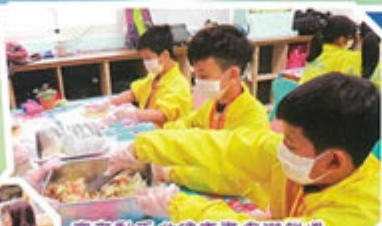
齊來動手做環保東區環保餅