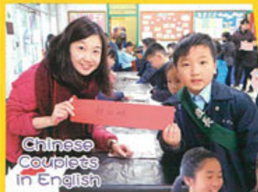
Chinese Couplets in English

The programme this year was much different from before because we introduced e-learning tools to our games and activities. We sang songs, read aloud tongue twisters, played games on iPads, designed our own couplets for Chinese New Year, and played lots of games. We learned about different festivals, popular culture, people around us and different countries around the world. English Speaking Days were definitely one of the highlights this year! We look forward to more exciting and innovative activities next school year.