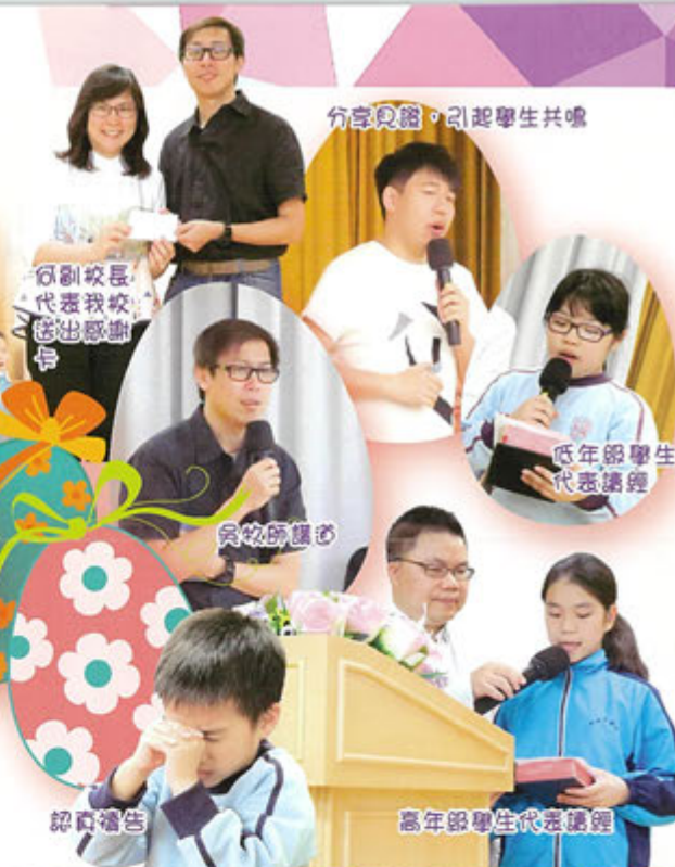
分享見證，引起學生共鳴