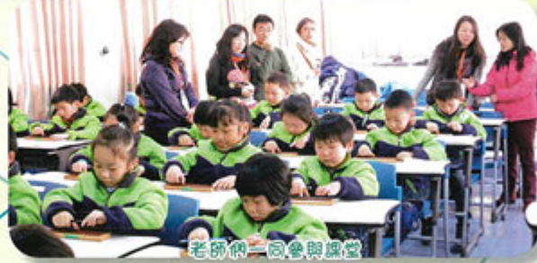
老師們一同參與課堂