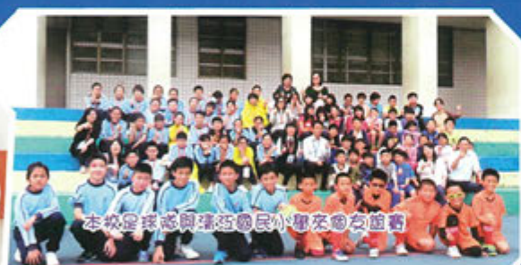
本校是球感與瑞巧國民小學來團友合照