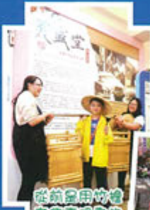
從前是用竹筒來灌溉農田的