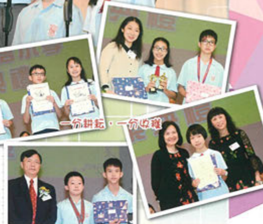
一份耕耘，一份收穫

回首過去，我們能有今日的成就，老師們實在功不可沒。老師六年來的春風化雨，令我們長大成人，他們的教導令我獲益良多。雖然我即將成為中學生，但對於母校的點點滴滴，我絕不會忘記。