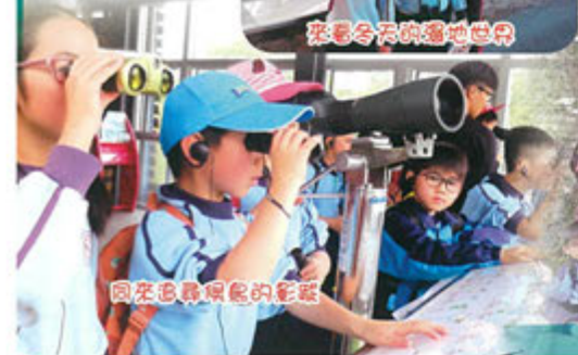
回來看看候鳥的影蹤