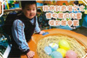
我們到香港文化博物館的兒童展館參觀