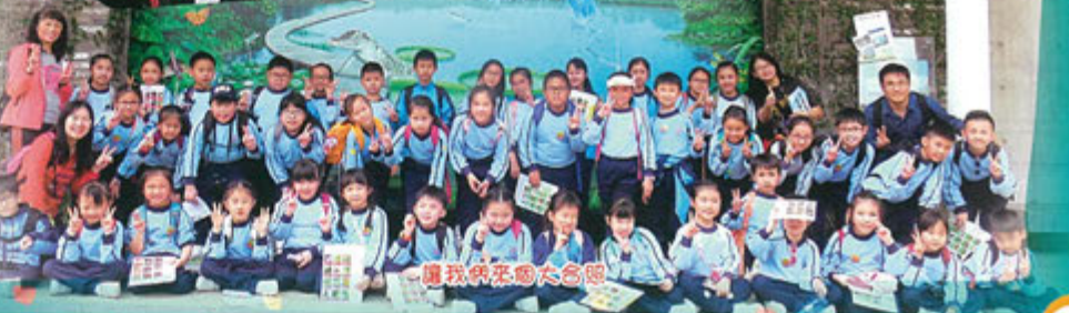
讓我們來拍大合照