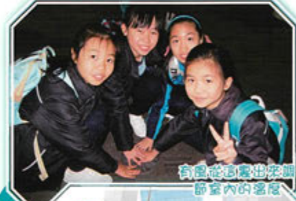
有風從這裏吹來 節室內的溫度