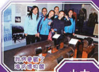
我們參觀了 海防博物館