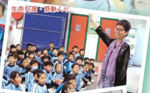
生命見證，感動人心