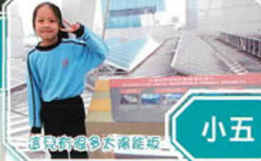
這兒有很多太陽能板