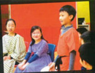
Sharing and discussing