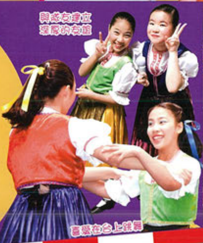
與志同道合的舞友

現在，我加入了西方舞隊已有四年了，在活動中，我認識到不少朋友，也從參加比賽中獲取經驗，增強自信心。我很開心能成為西方舞隊的一員。