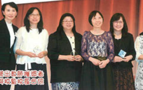
傑出教師獲委者與校董校長合照