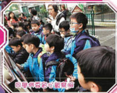
同學們認真地觀察呢