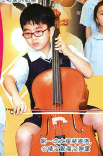
第一次大提琴表演，心情又緊張又興奮