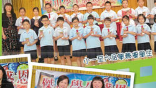
小一至六年級學業優異學生