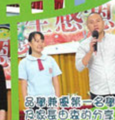
品學兼優第一名學 及家長由左的分享