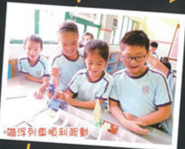
磁場列車順利起動

活動內容豐富，其中包括天文星象體驗、生物科技實驗、科學遊戲攤位及主題式探究活動等等。得蒙天父保守、教師們用心的預備及家長義工們鼎力協助，學生們都表現投入，在各項富趣味的探究活動中積極學習。