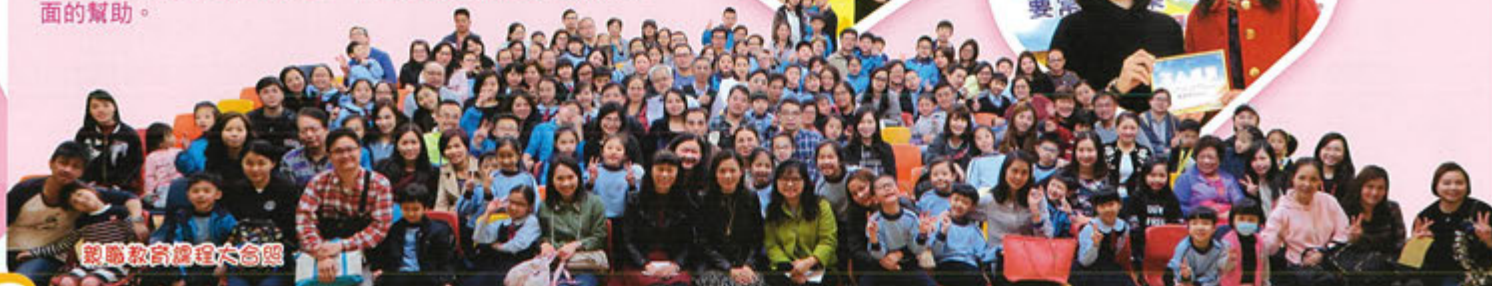
親職教育課程大合照