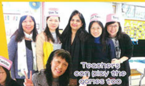
Teachers can play the games too