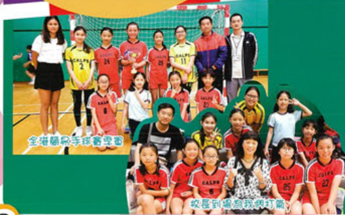
全港簡易手球賽冠軍