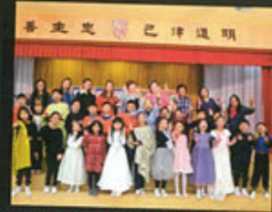
We are the Drama Team