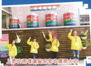
上面的兩隻桶是用來收集雨水的