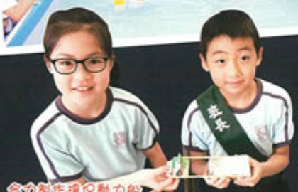
合力製作環保動力船