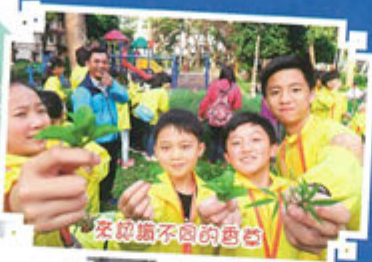
來認識不同的農畜