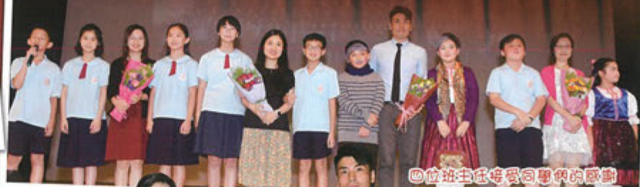
四位班主任接受同學們的感謝