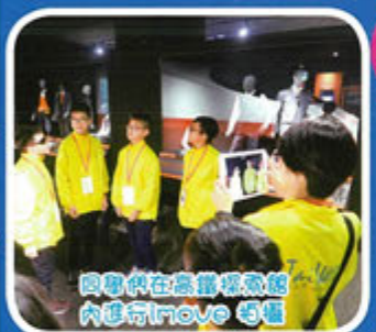
同學們在農場裡參觀 內進行插秧活動

在這五天裏，我看着五花八門的紀念品，卻也沒有輕易購物，還能管理好自己的金錢，可見我對比以往已增加了自己的理財能力。