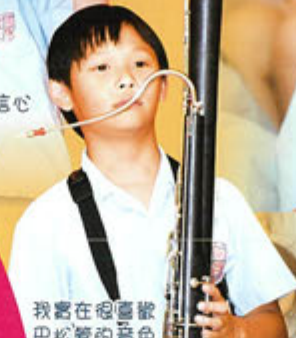
我實在很喜歡巴松管的音色