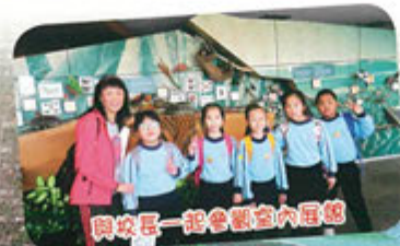
與校長一起參觀室內展廳