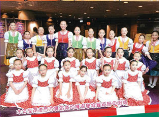
本年底兩隊西方舞隊均獲得學校舞蹈節中銀獎