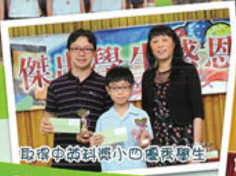
取得中級科學小四優異學生