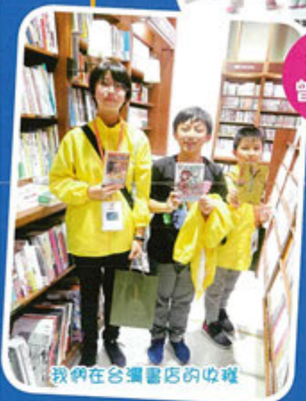
我親在臺灣書店的中樓