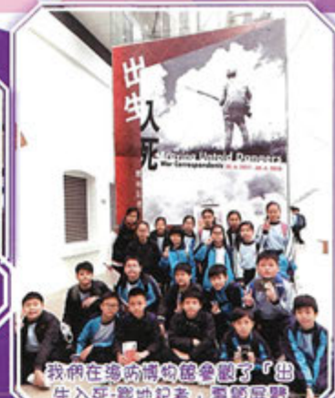
我們在海防博物館參觀了「出生入死-戰地記者」專題展廳