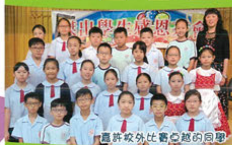
嘉許校外比賽卓越的同學

每當要安排傑出學生出席感恩茶會之時，就知道學期總結了；要檢討，要回顧，更要感謝我們的恩主。今天的早上有風有雨，我們的學生及家長仍冒着風雨，回到學校參加這個慶典，令我心中快慰。我們的人生何嘗不是時常遇上風雨，但我們仍是迎難而上，操練我們堅毅地面對人生的種種際遇。詩人經歷所得：「若不是耶和華建造房屋，建造的人就枉然勞力；若不是耶和華看守城池，看守的人就枉然儆醒。」今日學生所得的成就，全是賜生命的上帝所給的，榮耀歸與至高神。從上而來的祝福不斷，願意我們的學生「百尺竿頭，更上一層樓」。