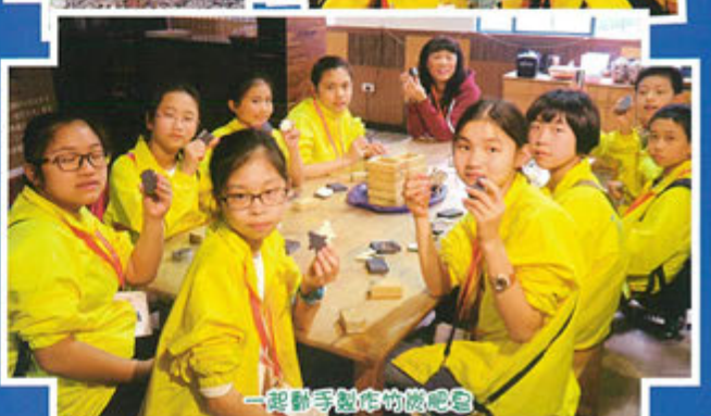
一起動手製作的農吧