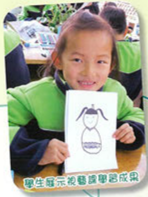
學生展示視藝課學習成果