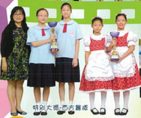
特別大獎-西方舞隊