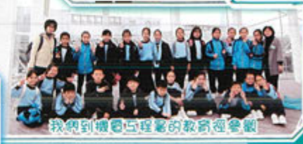
我們到機電工程署的教育徑參觀