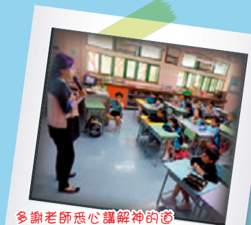
多謝老師悉心講解神的道