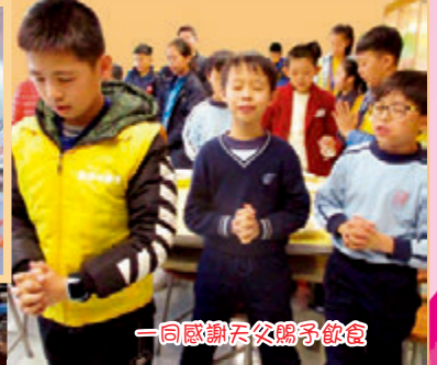
一同感謝天父賜予飲食