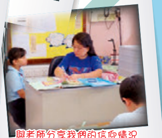
與老師分享我們的信仰情況