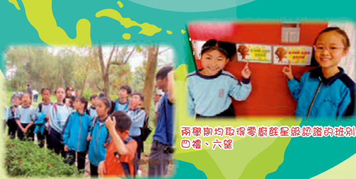
兩學期均取得零廚餘星級認證的班別：四禮、六望