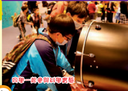
同學一起參與科學實驗