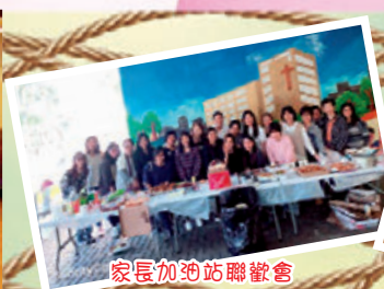
家長加油站聯歡會