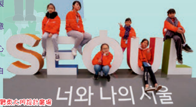
遊覽東大門設計廣場