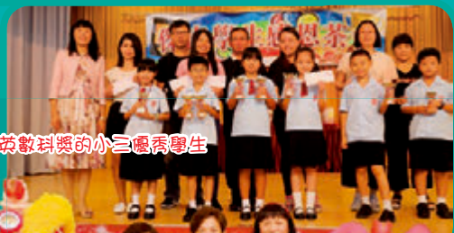
取得中英數科獎的小三優秀學生