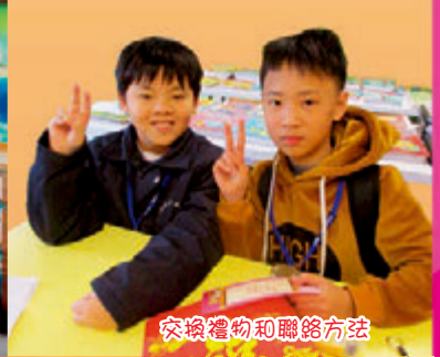
交換禮物和聯絡方法