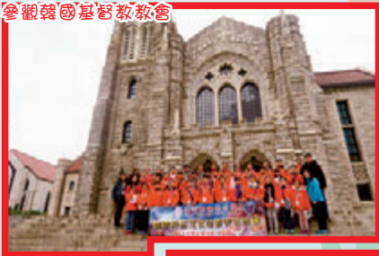
參觀韓國基督教教會