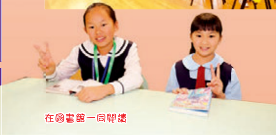
在圖書館一同閱讀