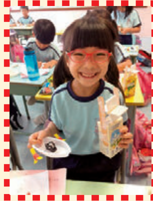
完成了環保動力船