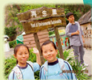
圖中包括回收玩具、舊書、碳粉盒等的小屋