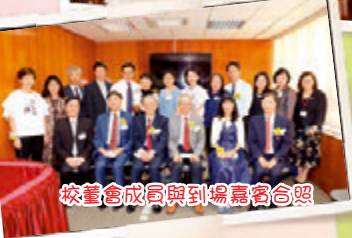
校董會成員與到場嘉賓合照