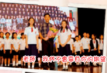
老師，我們不會辜負你的期望