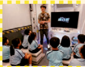
登上綠D班的車學習更多環保知識