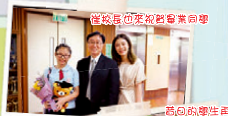
崔校長也來祝賀畢業同學

在此我們要再一次多謝校長及學校全體老師們和教職員悉心教導。祝願迦密愛禮信小學，往後每年都培育更多榮神益人的學生，彰顯主愛，並高舉主名。