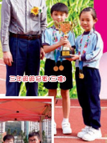
三年級級冠軍(三禮)