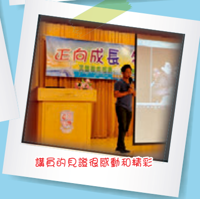
講員的見證很感動和精彩