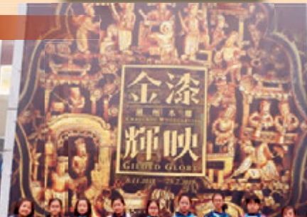
同學在老師帶領下一起參觀歷史博物館