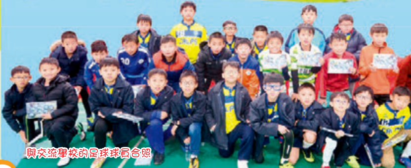
與交流學校的足球球員合照