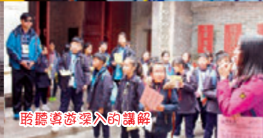
聆聽導遊深入的講解