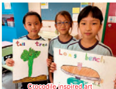
Crocodile inspired art

Reading skill is indisputably an integral part of life. Once reading is mastered, reading to learn begins, which initiates the learner into the world of knowledge.