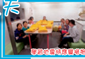
學習地震時應變措施