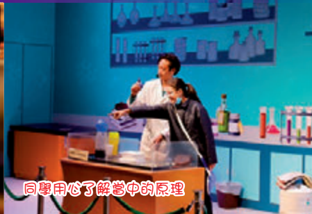
同學用心了解當中的原理