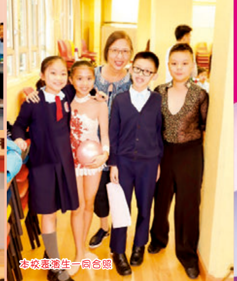
本校表演生一同合照