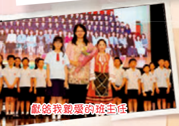
獻給我親愛的班主任