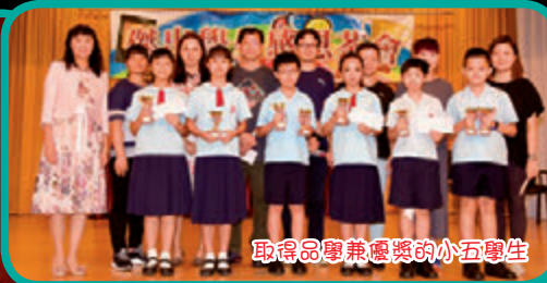
取得品學兼優獎的小五學生