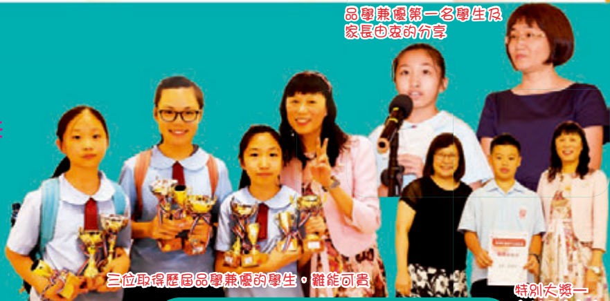
三位取得歷屆品學兼優的學生，難能可貴