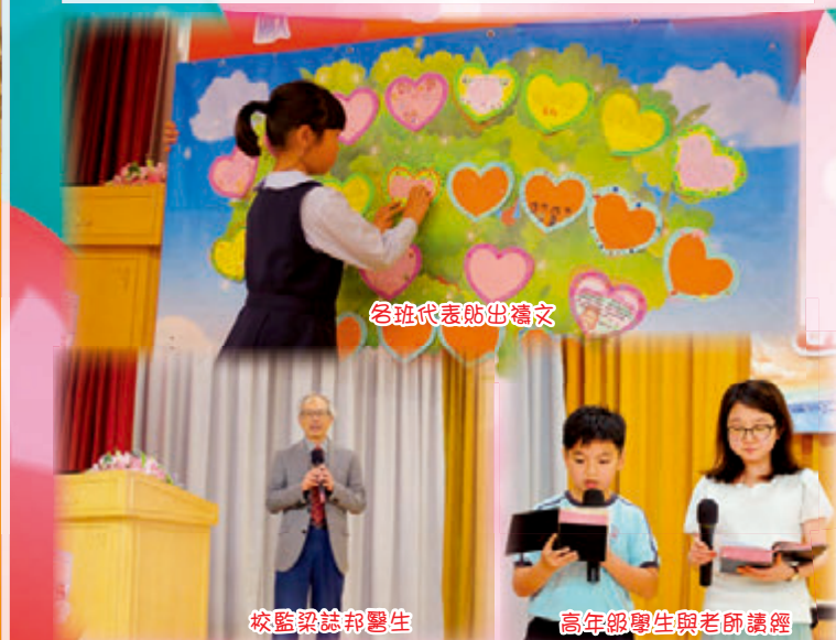
各班代表貼出禱文

2019年2月19日為本校校慶崇拜。承蒙梁誌邦校監勉勵學生。各班學生代表亦於獻心禮中讀出禱文，表達感恩的心。