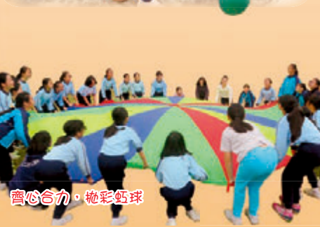
齊心合力，拋彩氈球