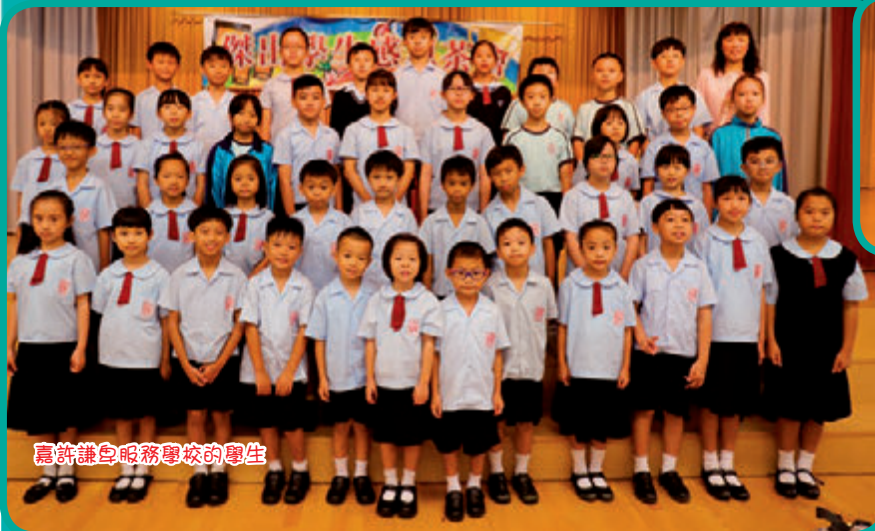
嘉許謙身服務學校的學生