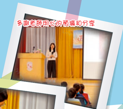
多謝老師用心的預備和分享