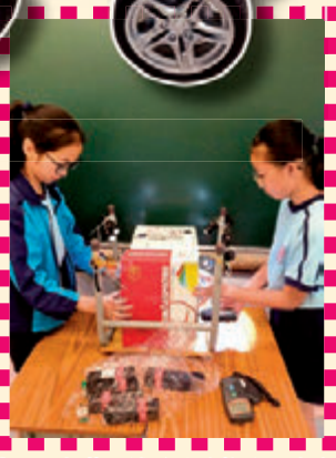
運用測光儀測試環保建築的採光度