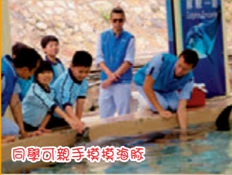
同學可親手摸摸海豚