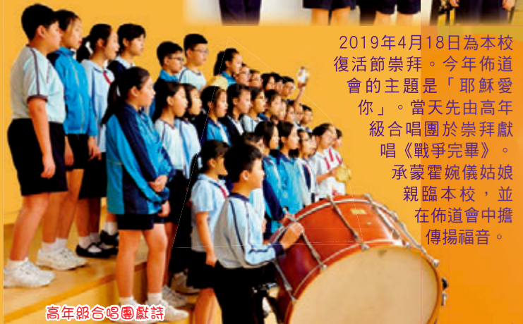
高年級合唱團獻詩

2019年4月18日為本校復活節崇拜。今年佈道會的主題是「耶穌愛你」。當天先由高年級合唱團於崇拜獻唱《戰爭完畢》。承蒙霍婉儀姑娘親臨本校，並在佈道會中擔傳揚福音。