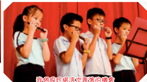
我們很珍惜這次表演的機會