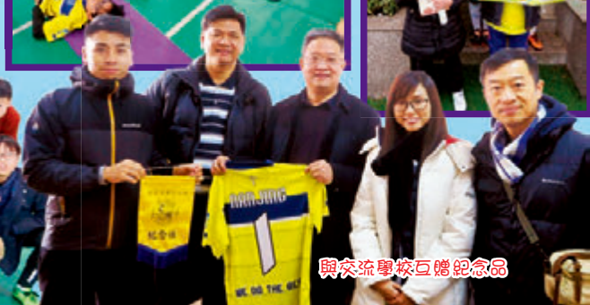
與交流學校互贈紀念品