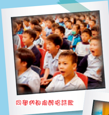
同學們都陶醉唱詩歌

今年度福音雙日的主題是：「耶穌愛你」。透過多類型的活動，例如：遊戲、詩歌分享、手工及見證等，讓本校學生了解，主耶穌不但深愛他們，更能帶領他們前路，讓他們經歷到主耶穌所賜的平安！感謝主！經過在佈道會中，講員將主耶穌在十架的大愛，清楚地表達出來後，感動了多位同學願意決志信主！