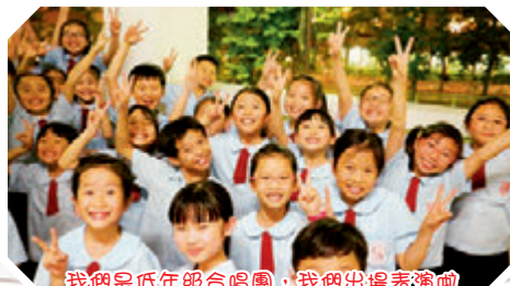
我們是低年級合唱團，我們出場表演囉