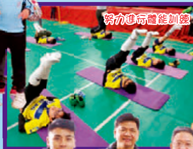
努力進行體能訓練

迎密靈禮信小學 Carmel Alison Lam Primary School 五天南京足球交流團 2018年12月23-27日