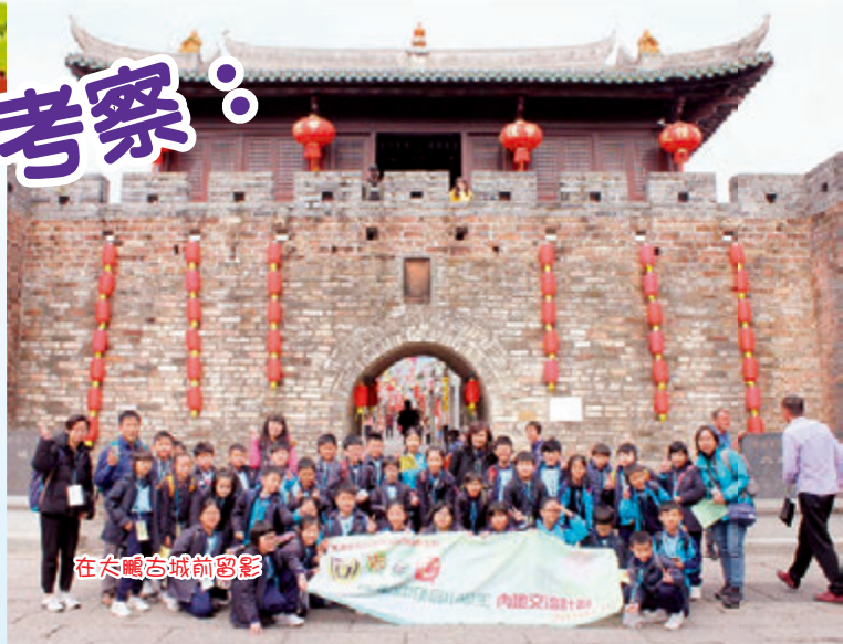
在大鵬古城前合影

本年度學校參與由教育局資助的「同根同心」高小學生內地交流活動計劃，參與活動名稱為「深圳自然環境及歷史文化探索之旅」，學生透過參觀大鵬半島國家地質公園博物館，讓學生認識古火山地貌、各地的岩石和礦物晶石，以及了解地球生物的進化歷程和自然環境的保育工作。另外，透過參觀大鵬古城及大鵬古城博物館，認識「中國歷史文化名村」的歷史，了解文物保育對當地經濟和民生的影響，並思考延續國家文化遺產的方式。總括而言，師生對行程都相當滿意，特別是有機會能到訪香港以外的地方，擴闊視野；除此以外，學生更能認識國家悠久的歷史文化，是一個寶貴的體驗。