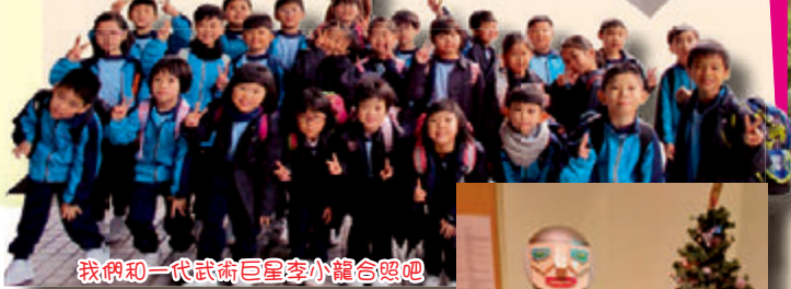
我們和一代武術巨星李小龍合照吧

一年一度的全方位學習日又到了，小一的同學興奮地走進香港動植物公園或九龍公園，同學們可以近距離觀察各種動物或進行種植活動。小二的同學的目的地是香港文化博物館，他們除了參觀兒童探知館，還看了不同的展館。小三同學分別參與了香港海洋公園學院的「南極高峰會」、「海獅游泳秘笈」、「動物成長過三關」或「海豚搜證三曲步」等課程，同學透過觀察海洋生物，加深了對牠們的認識。而小五同學就參觀了香港歷史博物館，認識一下香港的自然生態、民間風俗及歷史發展。而小六的同學就在香港科學館內不同的展品中穿梭，嘗試認識更多科學的原理，他們還參觀了「匠心獨運—鐘錶珠寶展」。透過全方位學習，學生可以跑出教室，進行多元化的學習，大大增加學習的樂趣呢！