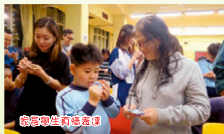
家長學生真情表達