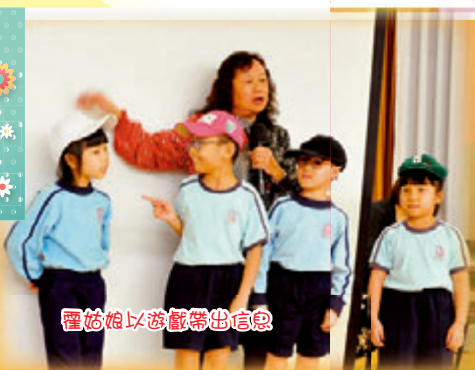
霍姑娘以遊戲帶出信息