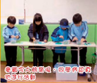
參觀完大熊貓後，同學們認真地進行活動