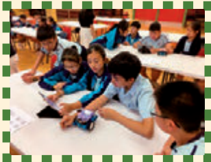
同學們認真地為mbot編程

活動內容豐富，邀請了TVB兒童節目《Think Big天地》嘉賓主持STEM Sir進行講座。另外，還有綠D班、Mbot學習活動、科學遊戲攤位及主題式探究活動等等。得蒙天父保守、教師們用心的預備及家長義工們鼎力協助，學生們都表現投入，在各項富趣味的探究活動中積極學習。