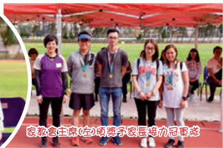
家教會主席(左)頒獎予家長接力冠軍隊