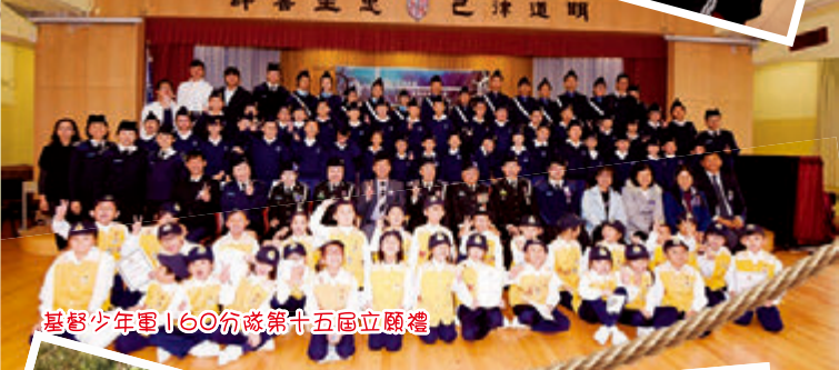
基督少年軍160分隊第十五屆立願禮

大圍平安福音堂進駐迦密愛禮信小學不知不覺已經十五年了。走過的日子留下了很多精彩的片段，因篇幅有限不能一一盡錄。在莊嚴而歡欣的堂慶感恩崇拜中，小朋友自選獻唱一首「活出愛」，以表達他們願意讓耶穌的愛激勵自己成為別人的祝福。望著台上投入獻唱的小朋友，彷彿看著當年的黃毛小子，今天有部份已成為導師，一起參與服侍迦密的學弟學妹，心中無限感恩。願意基督無私愛人的精神能一代一代的一直傳承下去！