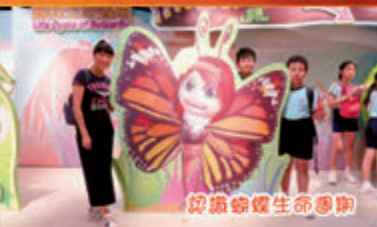
欣賞蝴蝶生命圖廊

為鼓勵學生自主學習，挑戰自我。本學年各科組設立了獎勵計劃，鼓勵學生在課堂內外，積極學習。在此計劃中表現卓越的學生被邀請參與「校長派對」，以示表揚。派對在「The Green Atrium」舉行，校長與學生一起參觀「綠色行星互動教育廊」、「蟲蟲大歷險視聽畫廊」及「食物之旅」。透過是次活動，學生能學習可持續發展、生態及環保的知識。