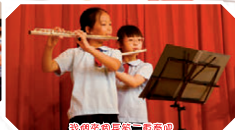
我們來個長笛三重奏吧