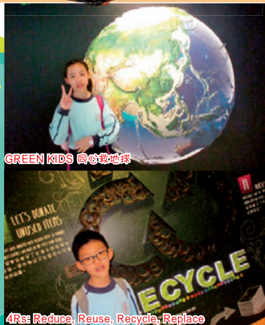
GREEN KIDS 同心救地球