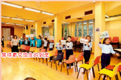
等待着交流生的到來

去年12月5日，深圳市海濱實驗小學師生一行70人到校作交流。透過是次交流活動，加強師生對內地教育的了解、促進文化交流、擴大學校網絡、提升教師專業水平，以及擴闊學生視野。