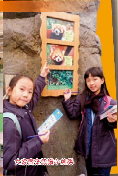
大家齊來認識小熊猫