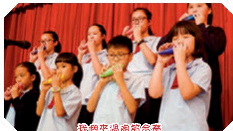
我們來個陶笛合奏