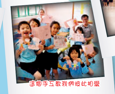
這個手互教我們彼此相愛