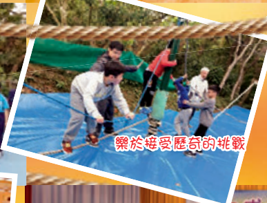
樂於接受歷奇的挑戰