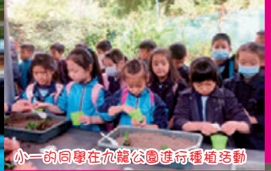
小一的同學在九龍公園進行種植活動