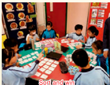
Sort and win