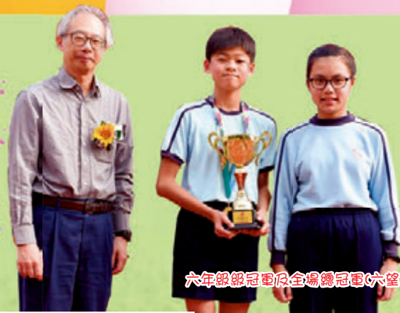
六年級級冠軍及全場總冠軍(六望)

在第十五屆的運動會中，感謝天父給予我們盡心協助的家長義工及畢業生，所以各項田徑及親子競技比賽皆能順利進行，同學們都能發揮應有水平，並且共有七項紀錄被打破。此外，大家共同見證天父給了我們良好的天氣，令同學與家長共享了一個美好難忘的運動會！