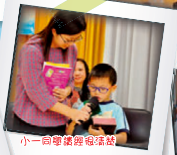
小一同學讀經很清楚