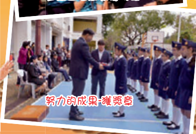
努力的成果-獲獎章