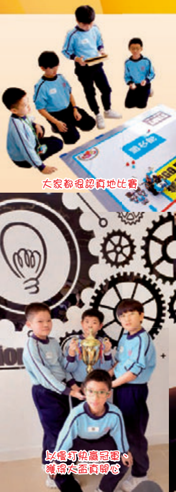
大家都認真地比賽