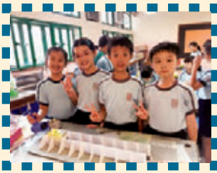
磁浮列車順利起動