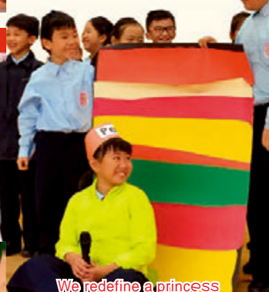
We redefine a princess