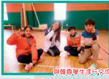
與韓國學生進行交流