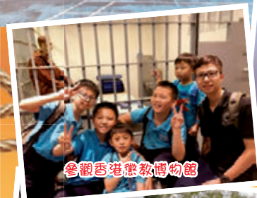
參觀香港教博博物館