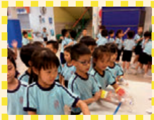
我們可以玩不同的攤位遊戲，真開心