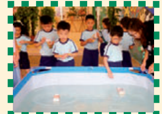
誰的小船行得較遠？