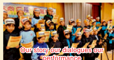
Our story our dialogues our performance