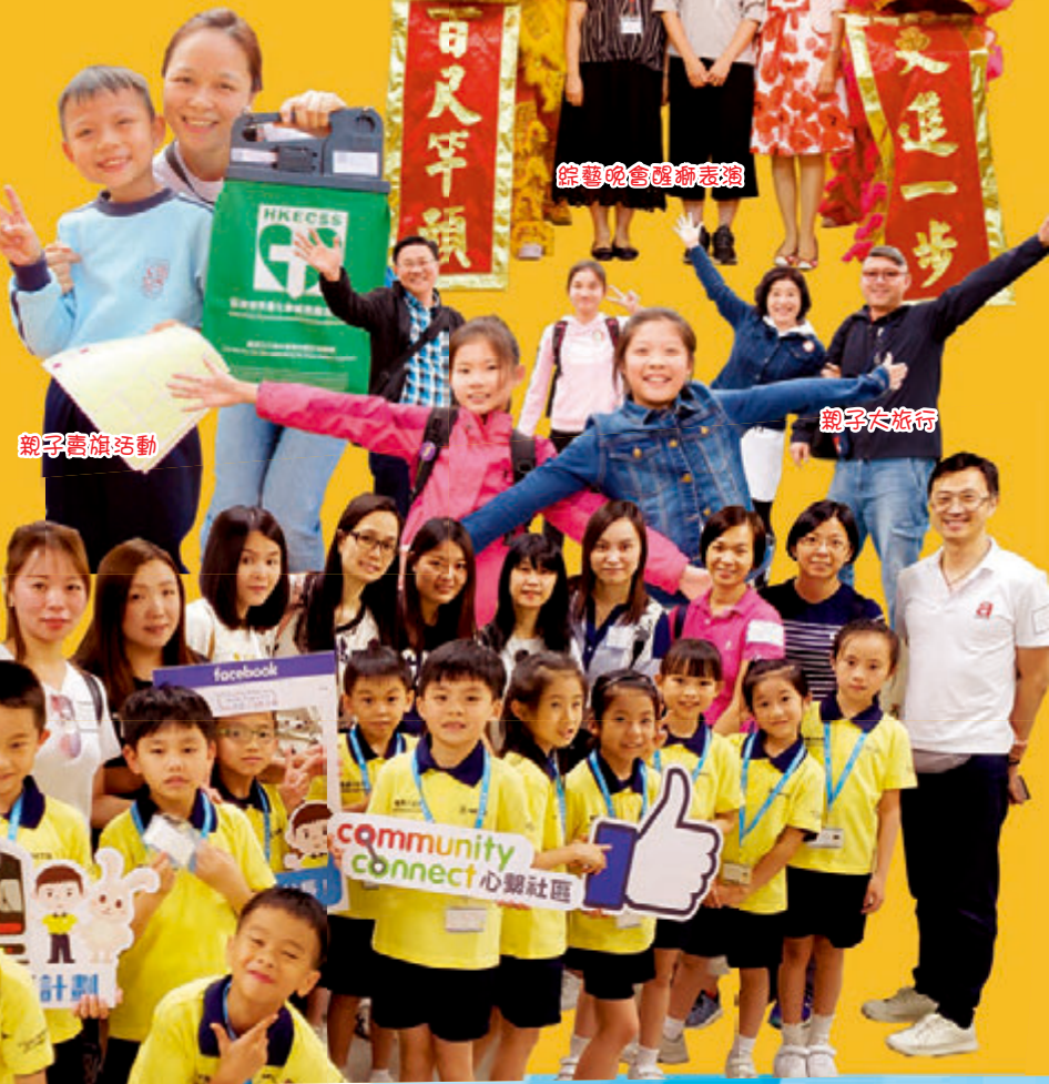
綜藝晚會醒獅表演

第十九屆家長教師會的任期快將圓滿結束，回望這一年間，家長們積極地協助我們，又提供寶貴的意見，實在難得，家校合作委實充滿感恩和喜樂！本年度家長教師會舉辦了很多活動，計有「親子賣旗」、「家長拉筋班」、「親子大旅行」、「港鐵小站長計劃」、「伴你高飛獎勵計劃」、「親子手工藝班」和「綜藝晚會」等。委員們精心地策劃活動，家長義工協助各項活動的進行，如作領隊等。幾乎每天都會見到家長們到學校協助我們，施予援手。家長委員和義工們無私的奉獻和支持，令我們十分感動。「一切很美，只因有你！」有部分家長委員即將離任，我們會保持聯絡，相信在不久的將來，定能在學校各項的盛事與各位再次聚首，互相分享喜悅！