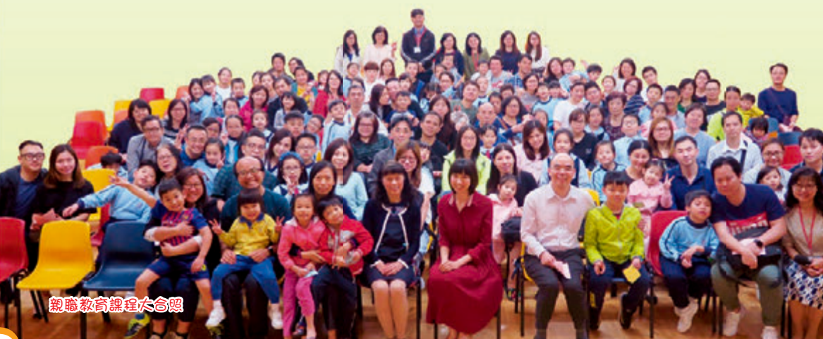
親職教育課程大合照