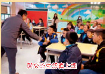
與交流生認真上課

二十位來自南澳小學的尖子學生，在港參與「寫作小能手」決賽後，由本校學生作為接待家庭，讓他們在其家中留宿並體驗一下香港的生活。此外，尖子學生亦會與本校學生進入課室，參與學習。透過是次活動，令學生對兩地生活的異同有所認識，促進兩地文化交流，也能擴闊學生視野，提升關愛文化。