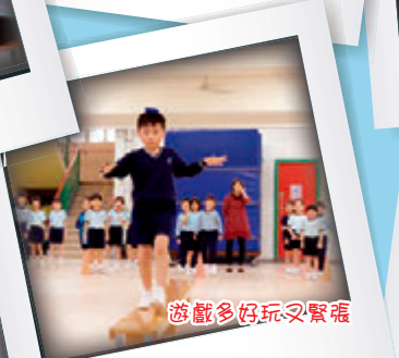
遊戲多好玩又緊張