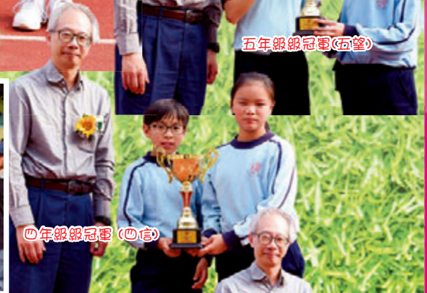
四年級級冠軍(四信)