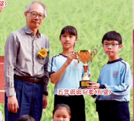
五年級級冠軍(五望)