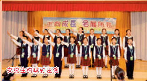
交流生的精彩表演