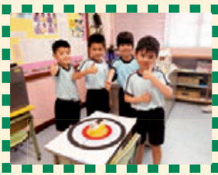
在分區進行測試，看看誰的家務助理機械人厲害