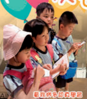
看我們多認真學習