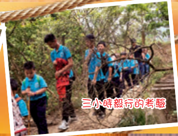
三小時毅行的考驗