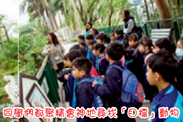
同學們都聚精會神地尋找「目標」動物