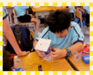
迷你吸塵機吸了很多紙屑