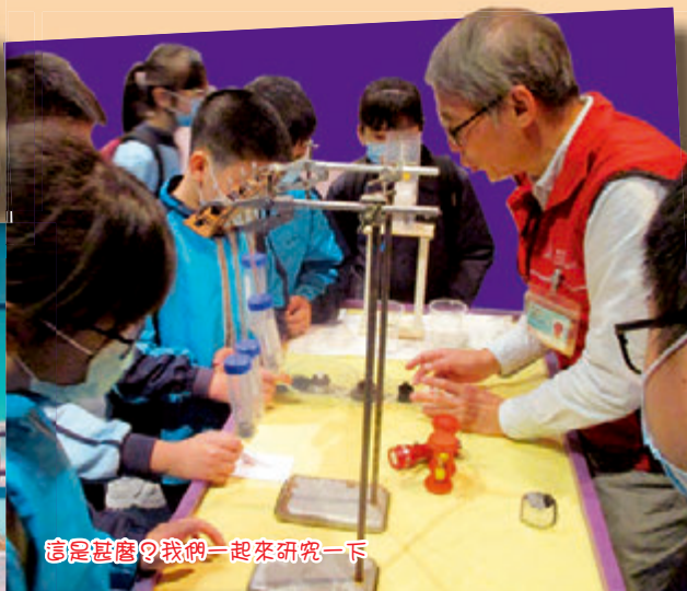
這是甚麼？我們一起來研究一下