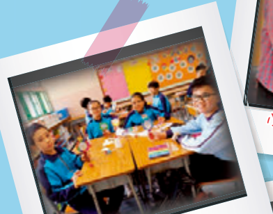
照一照，看看獨特的我們