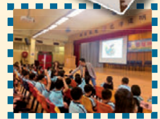
STEM Sir來到我學校進行講座