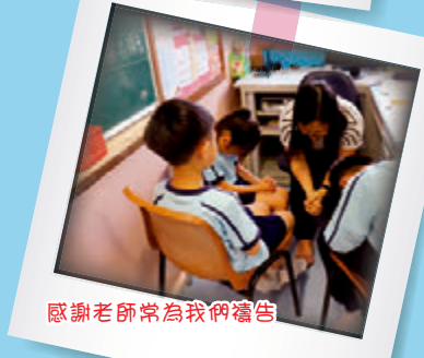
感謝老師常為我們禱告