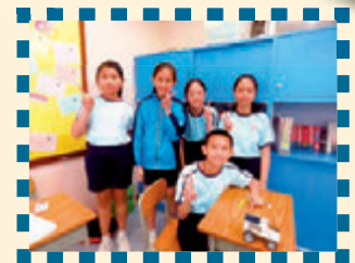
合力製作了太陽能車