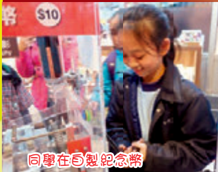
同學在自製紀念幣